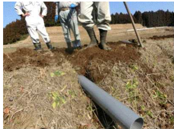
排水対策④パイプの敷設で畦畔の崩壊を防ぎ、ほ場外に水を排出させます。