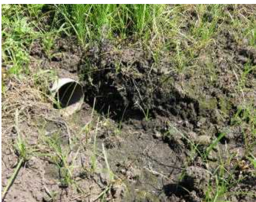
排水対策⑤排水口の点検整備を行います。