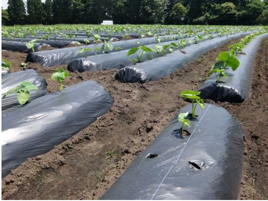
排水対策①畦に直交に整備された排水路