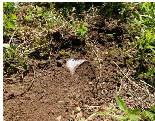
排水対策⑥このような状態では排水口が機能しません。