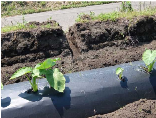
排水対策③確実にほ場外に水を排出させます。