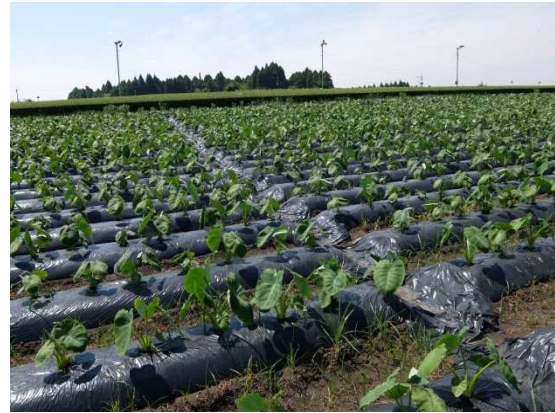
排水対策②傾斜の大きいほ場のため、表土流出軽減を目的にマルチで簡易集水路を整備している事例